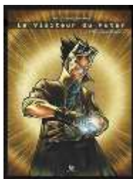
Fig. (3) : La fiche de l'album Le visiteur du futur: L'Élu des Dieux Cette BD qui peut être lue de manière autonome, présente une histoire inédite dans la continuité de la web-série. Le Visiteur est contrarié par le refus de Raph de l'aider, donc il décide de former une nouvelle équipe pour accomplir des missions et sauver le monde. Cependant, les choses prennent une tournure inattendue.

Le 13 juin 2013, entre les deux premières saisons de la série, parue aux éditions Ankama la BD titrée Le Visiteur du Futur : L'Élu des Dieux (figure 3). Cette bande dessinée a été écrite par François Descraques, mise en images par le dessinateur Gosh et colorisée par Stéphane Richard. Des extraits de cette BD ont été exposés à Japan Expo/Comic Con 2012 .