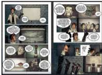
Fig. (4) : copie d'écran de la BD

est tellement drôle et divertissante. Les mouvements et les expressions faciales des personnages sont vraiment hilarants. Dans l'ensemble, la BD peut sembler un peu plus légère en termes d'intrigue, mais cette légèreté correspond parfaitement au ton de l'original, enchantant les fans et incitant ceux qui ne connaissent pas la série à la découvrir. Dans les illustrations, Gosh représente le protagoniste principal comme un homme à tout faire qui a du mal à se fixer. Son style est à la fois minutieux et caricatural, tout en préservant l'essence de l'histoire originale (figure 4).