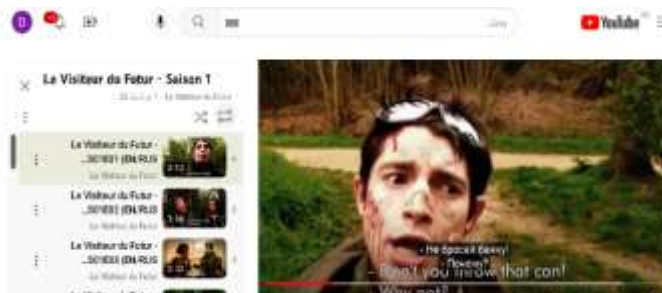
Fig. (2) : capture d'écran de la web-série Le Visiteur du Futur sur YouTube

François Descraques 7 , l'un des pionniers du transmédia en France, est le créateur et scénariste de la célèbre web-série française Le Visiteur du Futur . Cette web-série est une comédie de science-fiction qui est lancée pour la première fois le 26 avril 2009 sur le site de vidéos en ligne Dailymotion , avant de passer sur NoLife et YouTube (figure 2). Comportant 4 saisons (57 épisodes de 2 à 28 minutes), elle s'achève en 2014. Réalisée d'abord par François Descraques lui-même, puis par Ankama Productions et France Télévision, Le Visiteur du Futur a rencontré un grand succès, créant une communauté de fans rarement vue en France qui compte actuellement plus de 52 millions de vues. Grâce à la création de cette web-série, François Descraques commence à se faire un nom.