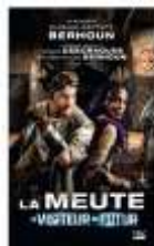
Fig. (5) : La fiche du roman numérique La Meute

Après avoir terminé la réalisation de la saison 4 de la web-série, Slimane-Baptiste Berhoun écrit le reste de la série sous la forme d'un roman numérique en 5 tomes, sous la direction de François Descraques. Le livre La Meute a été publié au format ebook le 18 février 2015 par l'éditeur Bragelonne (figure 5). Plus tard, le roman a connu sa première publication en version papier le 19 juin 2015 grâce à l'éditeur Milady. En 2022, il a été réédité pour accompagner la sortie du film Le Visiteur du Futur . Ce roman, bréquel de la web-série, provoque des faits antérieurs à cette œuvre en révélant principalement des informations et des mystères sur le passé du Visiteur, ce mystérieux voyageur temporel qui essaye de sauver la planète.