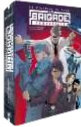
Fig. (6) : La fiche du manfra Le Visiteur du Futur : La Brigade temporelle

Les événements de ce manga n'ont pas de rapports avec le Visiteur éponyme de la série d'origine. Ils racontent l'histoire de Louise, une jeune fille intelligente mais impulsive, qui a subi un accident de voiture frôlant la mort. Une étrange Brigade sauve cette fille et la nomme comme nouveau membre de la Brigade Temporelle , chargée de prévenir les personnes malveillantes de s'immiscer dans l'Histoire. Louise découvre une opportunité exceptionnelle de vivre une aventure incroyable au centre d'un événement historique majeur. Pendant ce temps, une agence de voyages dirigée par le mafieux sans scrupules Métronome propose à ses clients fortunés des visites historiques. Dans ce manga, le protagoniste principal est Louise, accompagnée de Mattéo, Constance, Michel, Richard, Ben, Jessica et K-Stafolte.