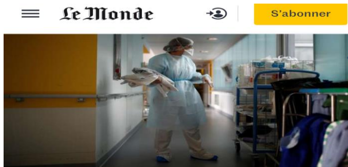
Au centre hospitalier de Vannes, le 12 octobre.