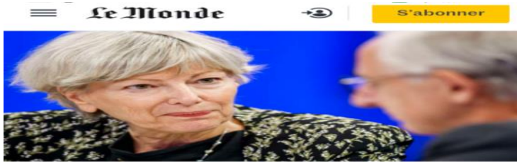
La présidente de la Haute Autorité de santé, Dominique Le Goudelec, à Chamonix, le 27 septembre 2019.