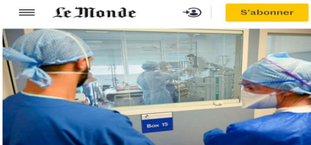
Le nombre de malades du Covid-19 hospitalisés en réanimation est au plus haut depuis mai.